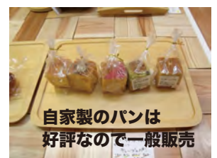
自家製のパンは 好評なので一般販売

ハックの家に通っている知的障がい者の作品等です、一部職員の手も借りていますが、発想力が素晴らしい（自閉症の方の作品）