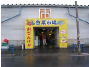
宮古市内@魚祭市場：市民の食を支える安くて大きな市民市場で近隣の漁師の奥さんが場内でも販売