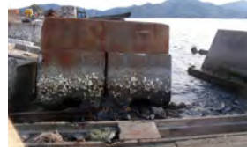
今なお撤去できない破壊 された岸壁