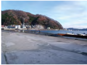
釜石の魚市場が解体 湾岸防波堤の破壊跡が 大型船の入港を阻む