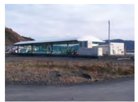
新しい魚市場 ここは大型船も接岸 可能