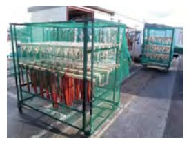
大槌の魚屋さん 新巻きサケの製造中