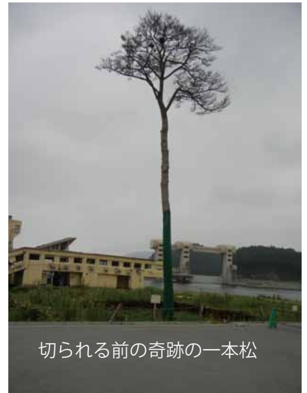
切られる前の奇跡の一本松