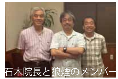
石木院長と狼煙のメンバー